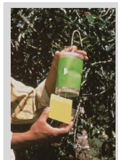
Рисунок 12. Безднищевая сухая ловушка (Этап IV).

Красные или зеленые ловушки этого типа могут использоваться без приманки, однако с приманкой они