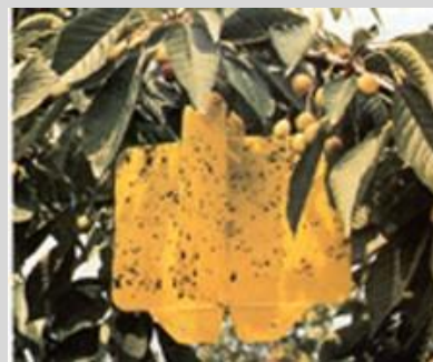
Рисунок 20. Ловушка "Ребелл".