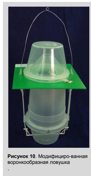
Рисунок 10. Модифицированная воронкообразная ловушка

Модифицированная воронкообразная ловушка состоит из пластиковой воронки и нижнего ловчего контейнера (рисунок 10). На верхушке воронки имеется большое отверстие (диаметром 5 см), над которым помещается верхний ловчий контейнер (из прозрачного пластика).