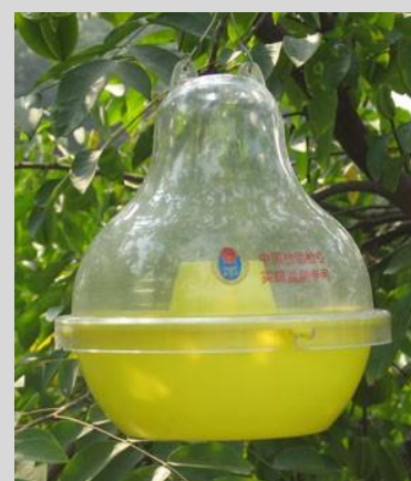
Рисунок 9. Пластиковая ловушка