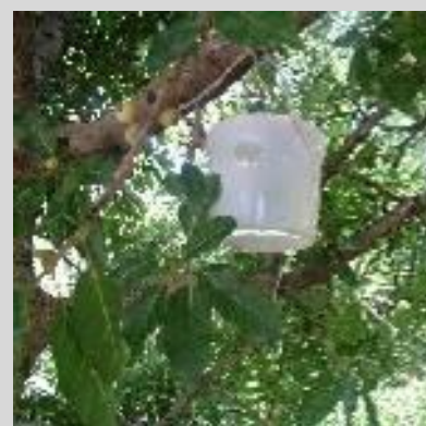
Рисунок 7. Ловушка "Магриб-Мед", или марокканская.