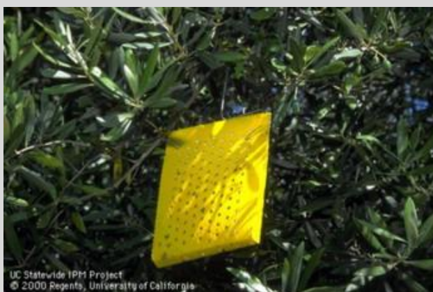
Рисунок 2. Ловушка «ЧемП»

Ловушка "ЧемП" – это полая желтопанельная ловушка, снабженная двумя клейкими перфорированными поверхностями. При сложенных обеих панелях ловушка имеет прямоугольную форму (18 см × 15 см), а в ее центральной части находится емкость для аттрактанта (рисунок 2). Проволочная подвеска вверху ловушки служит для ее размещения на ветвях деревьев.