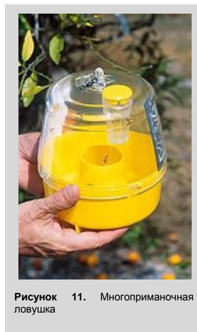
Рисунок 11. Многоприманочная ловушка

В случае использования MLT как сухой ловушки внутрь корпуса для умерщвления плодовых мух помещается лента, пропитанная соответствующим инсектицидом (не обладающим в используемой концентрации репеллентными свойствами), таким, как дихлофос или дельтаметрин (ДМ). ДМ наносится на полиэтиленовую ленту, которая помещается на верхнюю пластиковую платформу внутри ловушки. В альтернативном варианте ДМ может помещаться в круглую пропитанную москитную сетку и будет сохранять свои поражающие свойства в