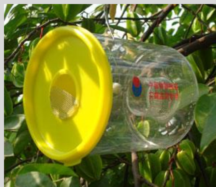
Рисунок 16. Вариант ловушки Штайнера.