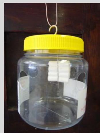
Рисунок 6. Ловушка Линфилда