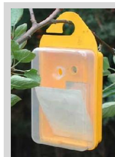
Рисунок 3. Ловушка "Easy"

Ловушка «Easy» представляет собой двухсекционный прямоугольный пластиковый контейнер со встроенной подвеской. Она имеет высоту 14,5 см, ширину 9,5 см, глубину 5 см и вмещает 400 мл жидкости (рисунок 3). Ее передняя часть прозрачна, а задняя – желтого цвета. Прозрачная передняя стенка контрастирует с желтой задней стенкой и тем самым повышает способность отлова плодовых мух с помощью данной ловушки. Визуальный эффект сочетается в ней с воздействием параферомона и пищевых аттрактантов.