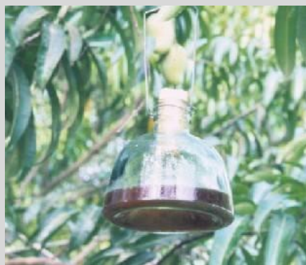
Рисунок 8. Ловушка Макфайла

Основным условием надлежащего функционирования этой ловушки является поддержание чистоты в ее корпусе. В некоторых конструкциях предусмотрено разделение корпуса на две части – верхнюю и нижнюю, что облегчает обслуживание ловушки (обновление приманки) и досмотр отловленных особей плодовой мухи.