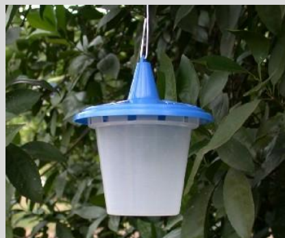
Рисунок 14. Ловушка «Сенсус»

Ловушка Штайнера представляет собой горизонтальный цилиндр из светлого пластика с отверстиями на обоих концах. Стандартная ловушка Штайнера имеет длину 14,5 см и диаметр 11 см (рисунок 15). Существует целый ряд модификаций ловушек Штайнера; к ним относятся модели длиной 12 см и диаметром 10 см (рисунок