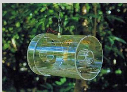
Рисунок 15. Стандартная ловушка Штайнера.