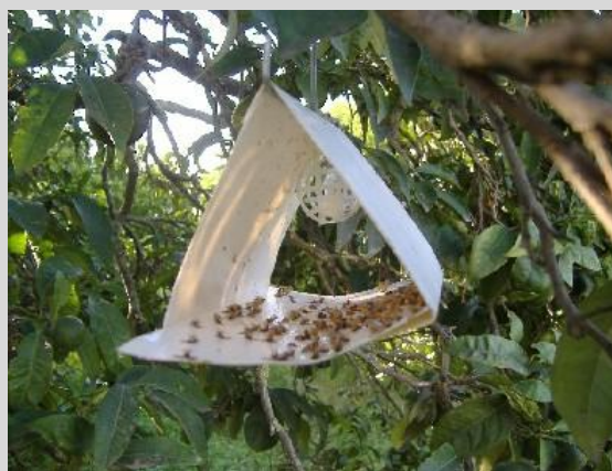
Рисунок 5. Ловушка Джексона, или «Дельта».