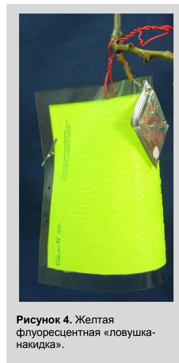
Рисунок 4. Желтая флуоресцентная «ловушка-накидка».