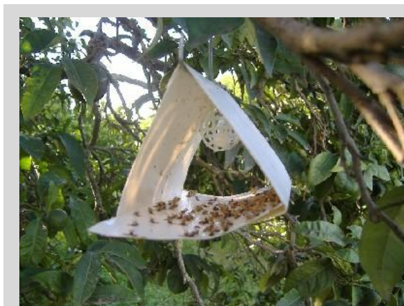
Рисунок 5. Ловушка Джексона, или «Дельта».

Ловушка Джексона является полой, имеет форму буквы «дельта» и изготовлена из белого вошеного картона. Ее высота 8 см, длина – 12,5 см и ширина – 9 см (рисунок 5). К ее дополнительным элементам относятся белая или желтая прямоугольная вставка из вошеного картона, покрытая тонким слоем клейкого вещества, применяемого для отлова плодовых мух, сающихся на внутреннюю поверхность корпуса ловушки; полимерная втулка или ватный тампон в пластиковой корзинке или проволочной оболочке; и проволочная подвеска в верхней части корпуса ловушки.