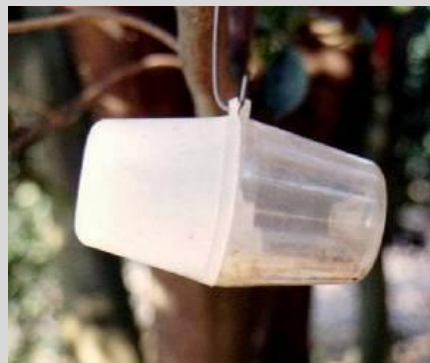
Рисунок 17. Вариант ловушки Штайнера.