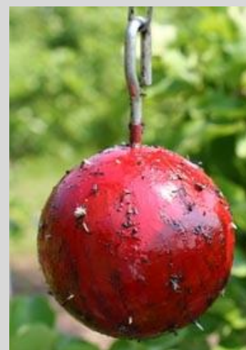
Рисунок 13. Красная сферическая ловушка