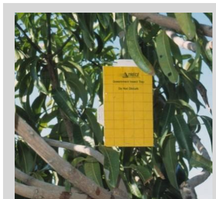
Рисунок 19. Желтая пластинчатая ловушка.

Размещение ловушек в пространстве зависит от цели обследования, отличительных характеристик зоны, биологических характеристик плодовых мух и их взаимодействий с их